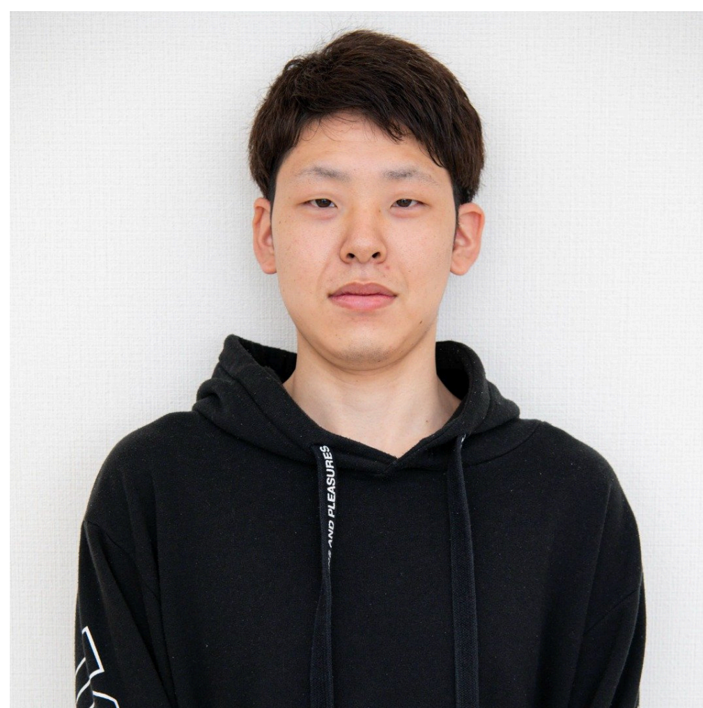
令和5年3月卒業 Yさん